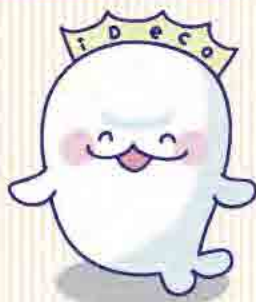
iDeCo普及推進 キャラクター イデコちゃん

〈中央ろうきん〉は、シンプルかつ低コストの商品ラインアップで 長期的な運用をサポート!