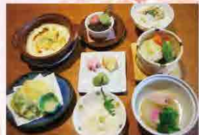
※仕入れの状況により献立に変更になる場合がございます