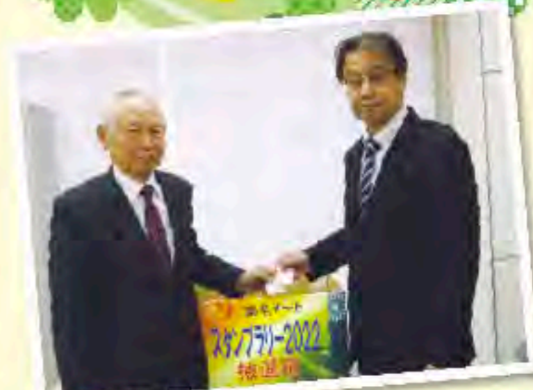
岩澤理事長(左)による 厳正な抽選を行いました。

今年度の スタンプラリーの応募数は 1,401 名でした。 たくさんのご応募 ありがとうございました!!